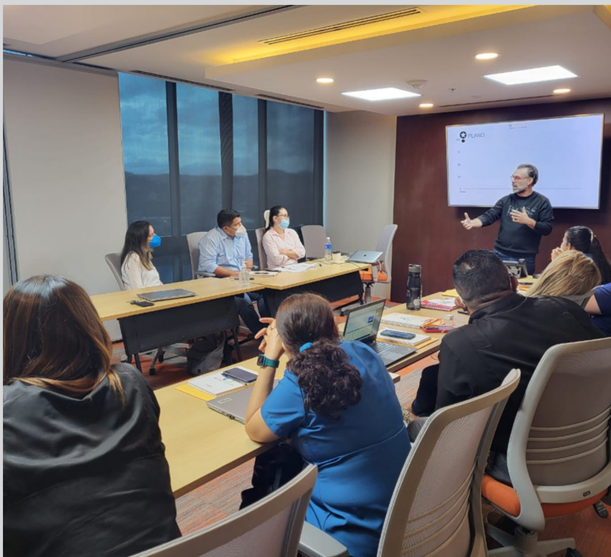
Sesión Formativa Nestlé el Salvador (Julio 2022)