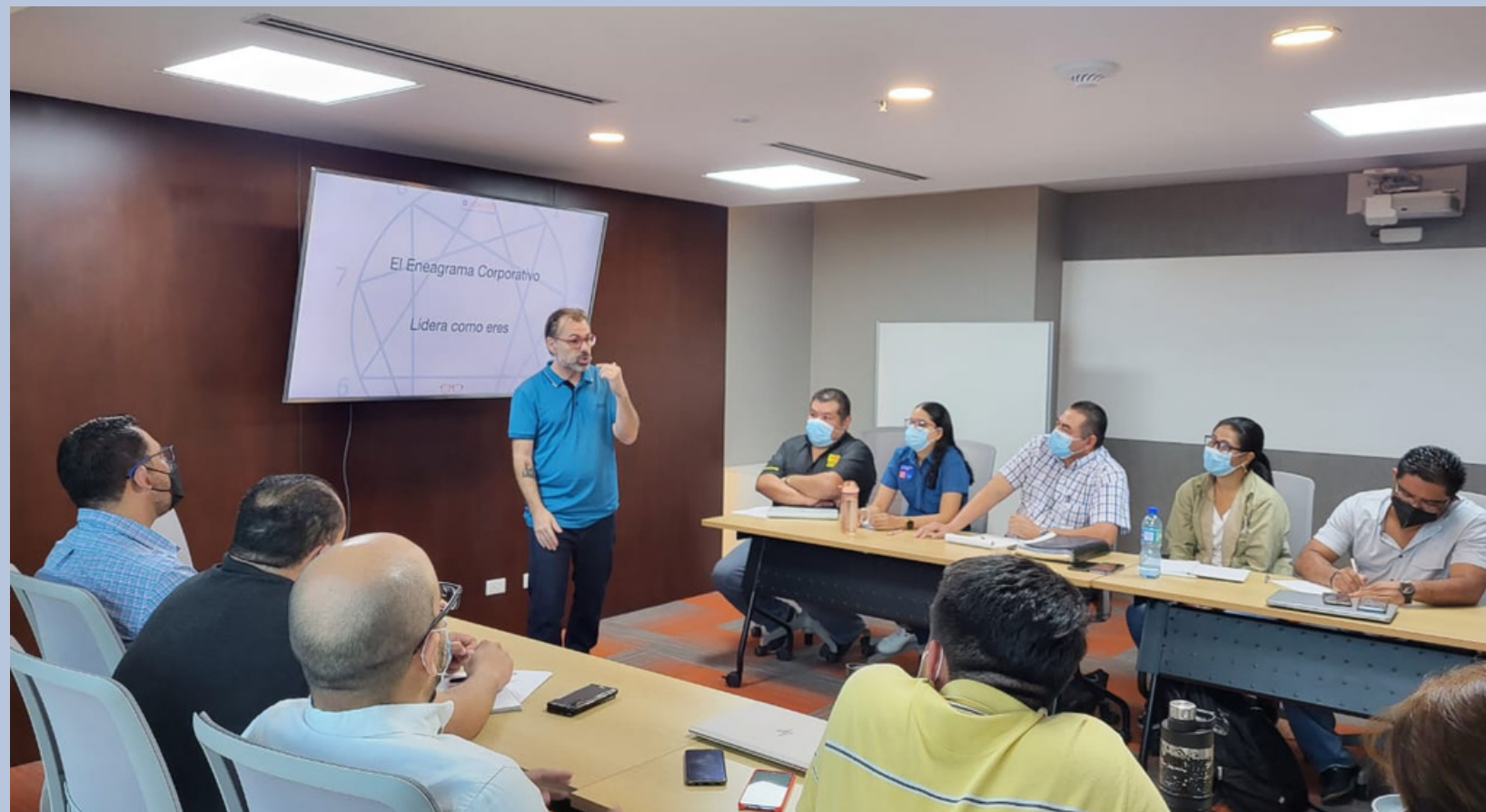
Eneagrama Corporativo, Salvatore Ferragamo, Mexico (2021)

En los últimos años he visto crecer de manera exponencial la demanda de organizaciones que apuestan por un liderazgo más humano.